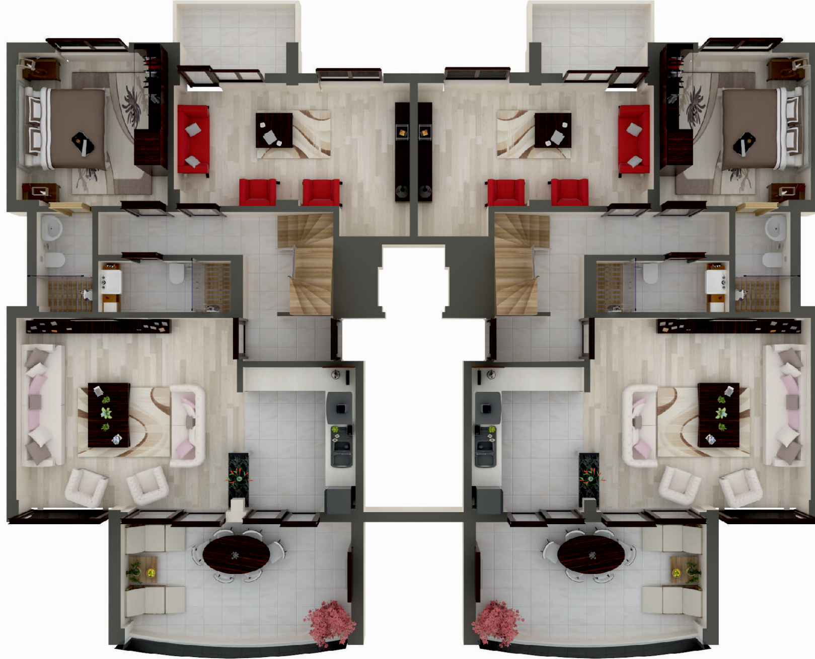
DUBLEKS NORMAL KAT PLANI