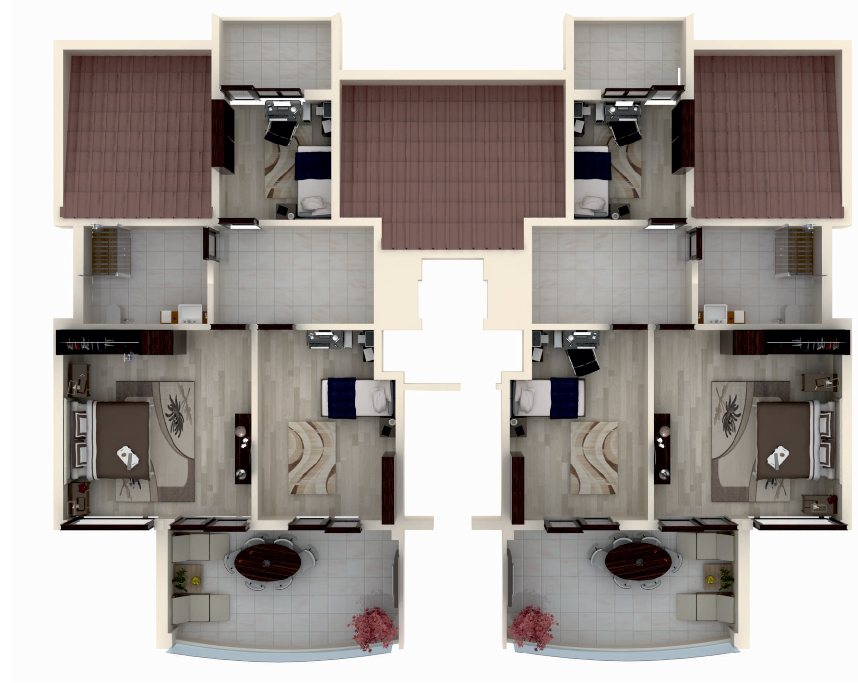
DUBLEKS ÜST KAT PLANI