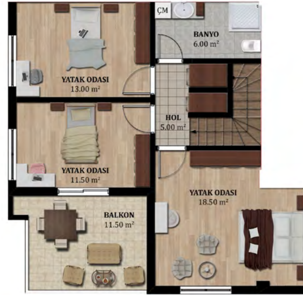
DUBLEKS ÇATI KAT PLANI