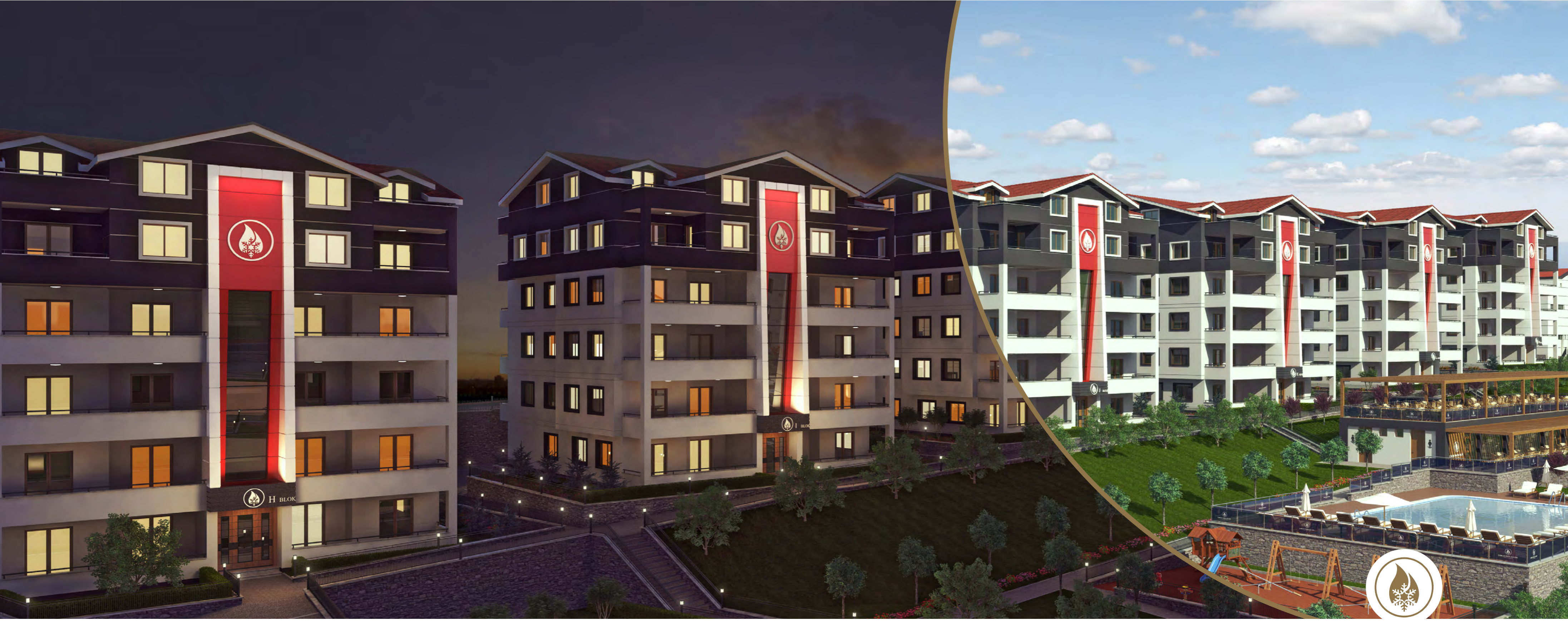
ÇAMLIK PARK EVLERİ