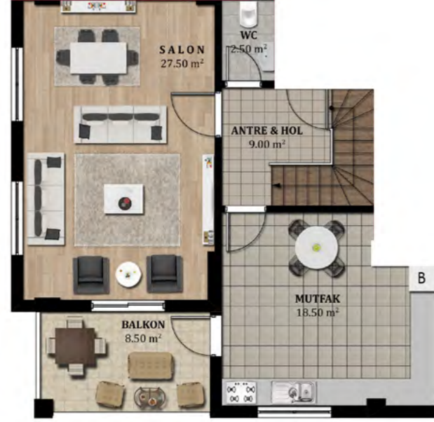
DUBLEKS NORMAL KAT PLANI