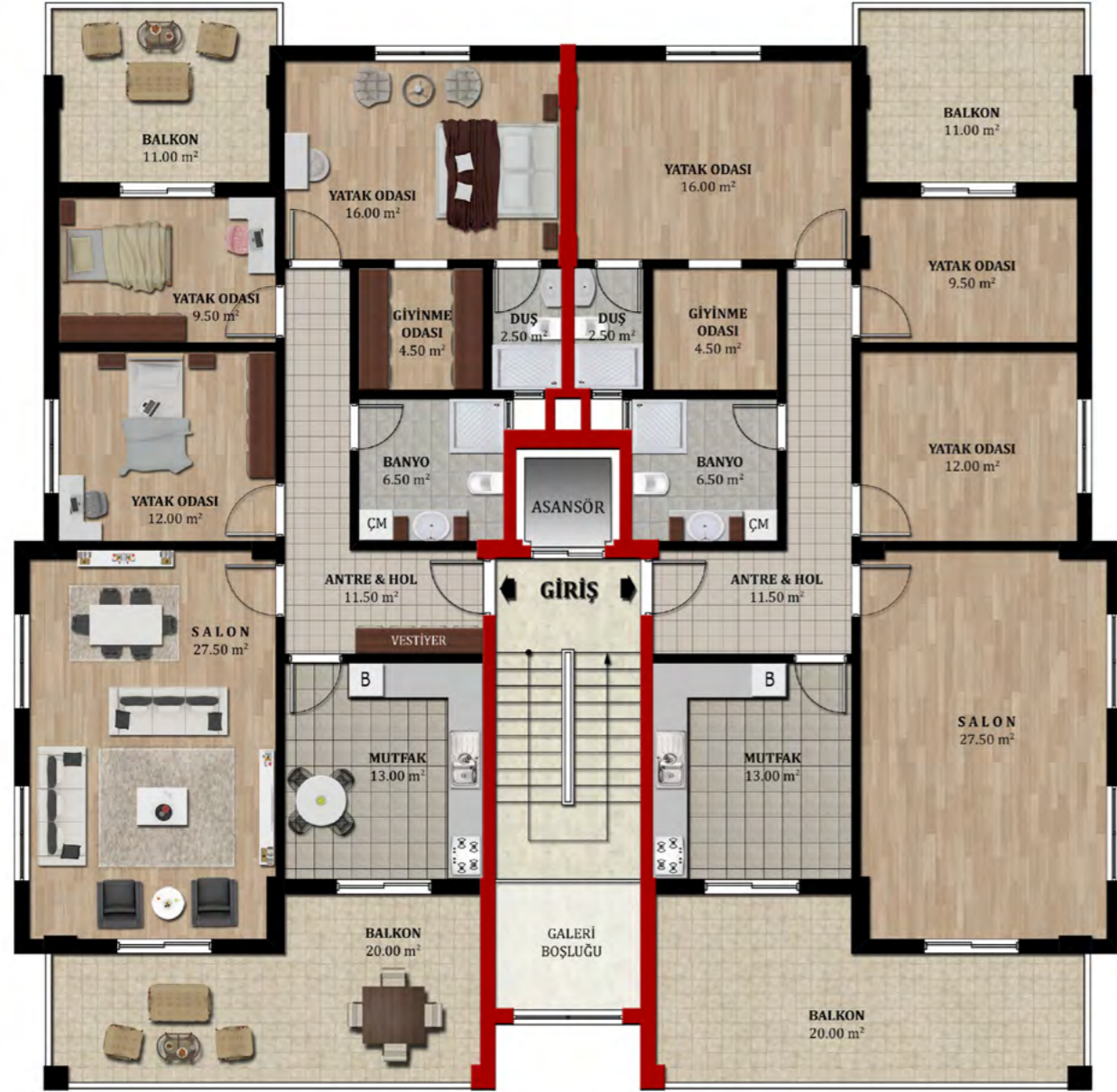
NORMAL KAT PLANI